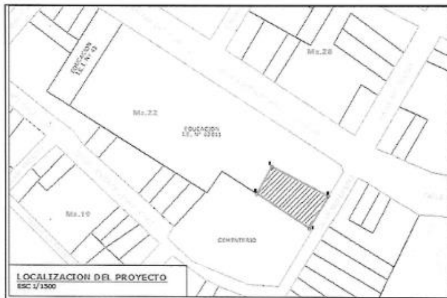
Figura 01: Plano de Ubicación de Vivero – Comunidad Munichis